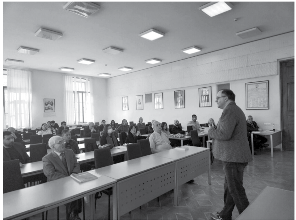
პროექტში ჩართულ მკვლევართა საქმიანობა ითვალისწინებს საქართველოს დემოკრატიული რესპუბლიკის ისტორიის შესახებ სამი ტომის გამოცემას მომავალი წლის დასაწყისისთვის.

ვექლო იმ პრობლემების გადაჭრა, რაც მთელი რუსეთის იმპერიის განმავლობაში არ ხდებოდა საქართველოში, რომ მოქალაქეებს არ ჰქონოდათ წვდომა განათლებას“, – განაცხადა ირაკლი ირემაძემ.