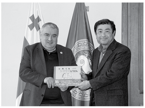
ტოკიოს მეტროპოლიტან უნივერსიტეტის წარმომადგენელი, პროფესორი პიროტაკე მადამ არის ქართველოლოგი და ირანისტი. აღნიშნულ პროგრამებში მონაწილეობა სტუდენტებსა და აკადემიურ პერსონალს შემდეგი სემესტრიდან შეეძლება.

თბილისის სახელმწიფო უნივერსიტეტსა და ტოკიოს მეტროპოლიტან უნივერსიტეტს შორის მომავალ თანამშრომლობაზე ისაუბრეს თსუ-ს რექტორმა ჯაბა სამუშიამ და ტოკიო მეტროპოლიტან უნივერსიტეტის პროფესორმა პიროტაკე მადამ. შეხვედრის მიზანი იყო თსუ-სა და ტოკიოს მეტროპოლიტან უნივერსიტეტს შორის ხელშეკრულების გაფორმება, სტუდენტებისა და აკადემიური პერსონალის მობილობების ორგანიზებაზე შეთანხმება. ამ ეტაპზე სამი მიმართულებით მიმდინარეობს ხელშეკრულებებზე მუშაობა: უნივერსიტეტებს შორის ძირითადი მემორანდუმი თანამშრომლობის შესახებ, სტუდენტთა გაცვლითი პროგრამის ხელშეკრულება და სადოქტორო საფეხურზე ორმაგი ხელმძღვანელობის ხელშეკრულება.