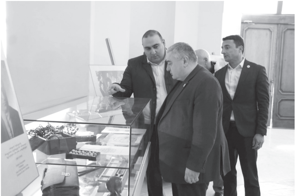
ერთობლივად ჩაუყარეს საფუძველი საქართველოში პირველი დიდი გიმნაზიის მშენებლობას, სადაც 1918 წლიდან უნივერსიტეტი განთავსდა. ჩვენს ექსპოზიციაზე წარმოდგენილია გეგმა იმ მიწისა, სადაც აშენდა ეს გიმნაზია. 1973 წელს შე-

„XIX-XX საუკუნეების მიჯნაზე ძალიან გააქტიურებული იყო სხვადასხვა საზოგადოებრივი მოძრაობები: „ღარიბ მოწაფეთა შემწე ტფილისის გუბერნიის თავად-აზნაურთა საზოგადოება“, „წერა-კითხვის გამავრცელებელი საზოგადოება“... მათ