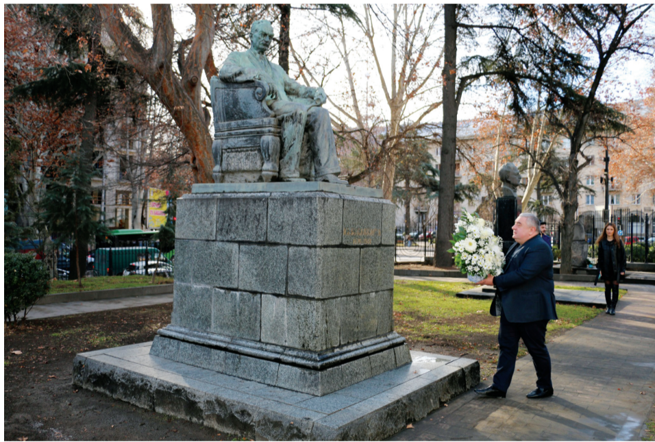
საუნივერსიტეტო საზოგადოებამ უვავილებით შეამკო ტსუ-ს დამფუძნებელთა საფლავები