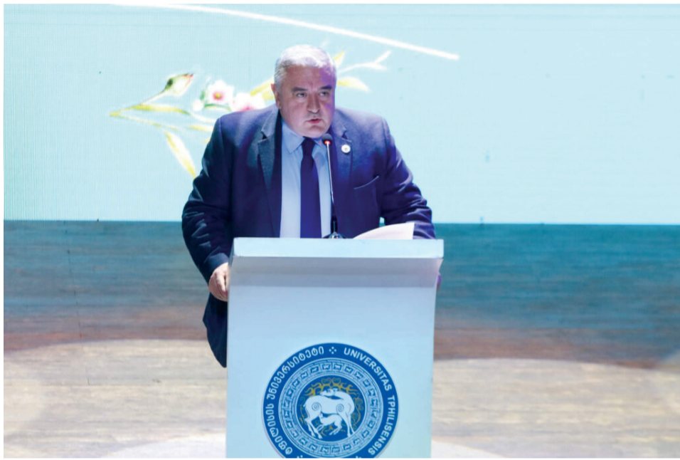
ტსუ-ს რექტორი ჯაბა სამუშია საიუბილეო საღამოზე სიტყვით გამოსვლისას

„ჩემთვის დიდი პატივია ეს ჯილდო, ამავე დროს, დიდი პასუხისმგებლობაც. ამ ჯილდოს ჩემთან ერთად ინანილებს მთელი ფაკულტეტი. ეს არის ხალხი, რო-