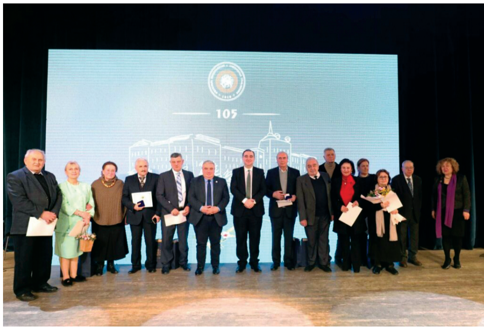
უნივერსიტეტის ოქროს მედლით 14 პროფესორი დაჯილდოვდა