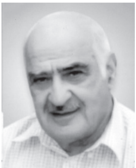
ქართველოს მეცნიერებათა აკადემიის წევრ-კორესპონდენტად, ხოლო 2002 წელს აკადემიკოსად.

1968 წელს თენგიზ სანაძეს ბორის ბერულავასთან ერთად მიენიჭა უნივერსიტეტის პირველი პრემია, ხოლო 1970 წელს გივი ხუციშვილთან ერთად — მედიკინის სახელობის პრემია. 1974 წელს თენგიზ სანაძე არჩეულ იქნა სა-